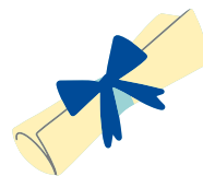
Analítico del secundario

Convertí tus archivos en PDF con esta web: