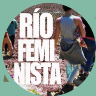
Integrantes de Río Feminista. Taller Flotante - Orilleras

Docente, integrante de asambleas socioambientales de Mendoza nucleadas en la AMPAP (Asambleas Mendocinas por el Agua Pura). Integrante de la Cátedra Libre de Soberanía Alimentaria de la Facultad de Educación de la Universidad Nacional de Cuyo.